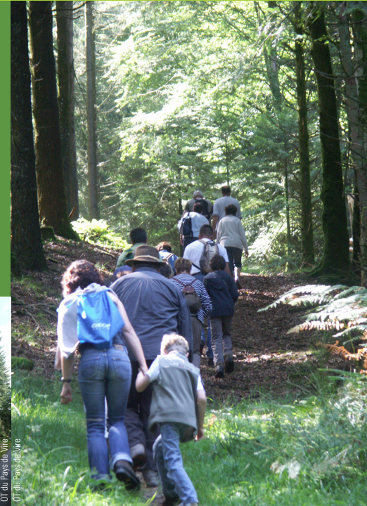
OT du Pays de Vire