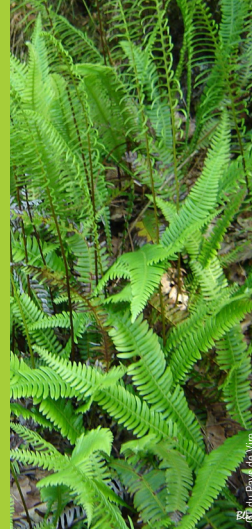
OT du Pays de Vire

Square de la Résistance; Vire 14500 VIRE NORMANDIE Tél. +33 (0)2 31 66 28 50 contact@paysdevire-tourisme.fr www.paysdevire-normandie-tourisme.fr