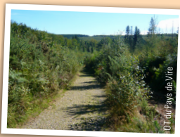
DT du Pays de Vire - A. Jönner