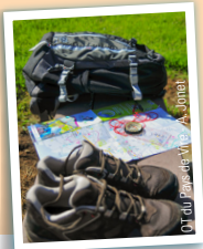
DT du Pays de Vire - A. Jönner