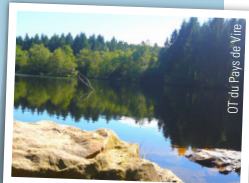
OT du Pays de Vire

Bien caché dans la forêt de Saint-Sever, entre la Tranchée de la Garde Bourgeoise et la route forestière de la Vissière, l'étang de Coulanges est uniquement accessible à pied ou en VTT. Si la pêche y est interdite, une digue permet de retenir l'eau et d'obtenir une belle vue sur le plan d'eau. Un abri forestier et une aire de pique-nique ont été aménagés pour profiter de ce havre de paix.