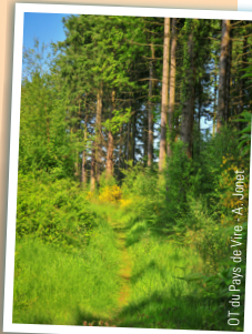
DT du Pays de Vire - A. Jönner

Tourner à gauche et continuer sur cette large piste pendant 150 m environ et s'engager dans le 2ème chemin à droite. Remonter et déboucher à nouveau sur une route forestière. Bifurquer à gauche et continuer sur cette large piste pour rejoindre le parking de départ.