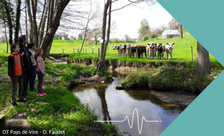
OT Pays de Vire - O. Faudet