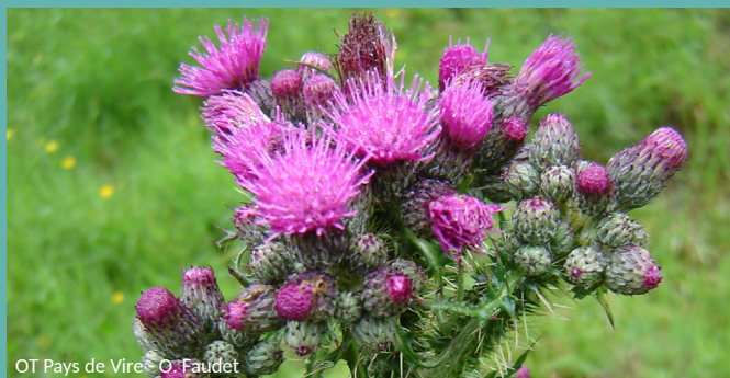
OT Pays de Vire - O. Faudet