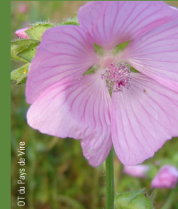
OT du Pays de Vire