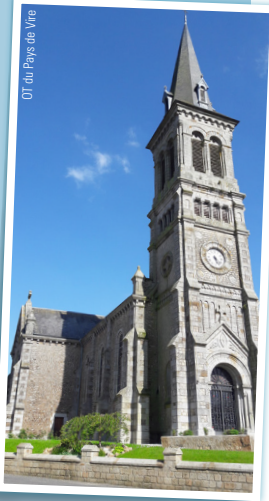
OT du Pays de Vire

Construite en 1885 sous la direction de Monsieur le Chanoine Mariette, l'église Saint-Martin est remarquable par l'élégante flèche du clocher qui atteint 55 mètres. Le style choisi avait été le roman le plus pur, copié sur les belles églises de l'époque, en particulier Saint-Gilles de Caen dont le curé s'était inspiré. Bâtie en moellons, extraits à Brouains aux carrières des Monts d'Eron, et en granit en provenance des carrières du Gast et de Gathemo, l'église est marquée à l'entrée du sanctuaire par un bloc de granit qui mesure 7,40 m. En 1975, le chanoine Vilain, curé de la paroisse, restaure les orgues et les vitraux dont certaines verrières mesurent 5,70 m de haut.