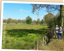
OT du Pays de Vire

Tourner à droite et peu après la sortie du bourg, prendre à gauche le chemin. Revenir au croisement de chemins initial et s'engager à gauche pour revenir vers le bourg de Truttemer-le-Grand.