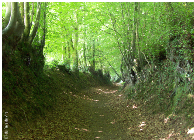
OT du Pays de Vire