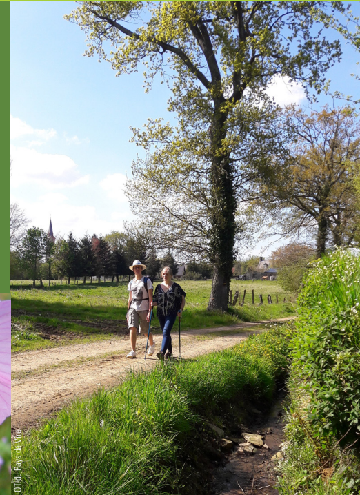
OT du Pays de Vire