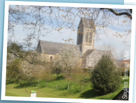
Seulles Terre et Mer

Cette église romane possède une nef datant du XI e siècle. Son portail occidental est joliment souligné par deux archivoltes à zigzags. Son clocher, inachevé et terminé en bâtière, date du XIV e siècle. En 1944, l'édifice a été éventré par des obus.