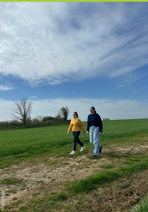
DT Gold Beach