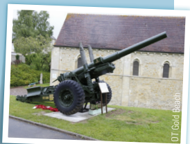
DT Gold Beach

Édifiée au XII e siècle, elle connaît un regain d'intérêt au XVIII e siècle et est rebaptisée église Saint-François. Au XIX e siècle, elle tombe en ruine et est désaffectée. Gravement endommagée en 1944 lors de la bataille de Normandie, elle est restaurée en 1974 et abrite aujourd'hui le musée de la bataille de Tilly.