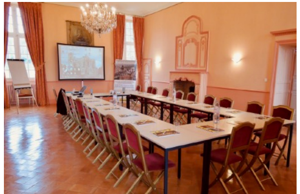
Le Salon Corail

PLAN DU CHÂTEAU / REZ-DE-CHAUSSÉE SURÉLEVÉ