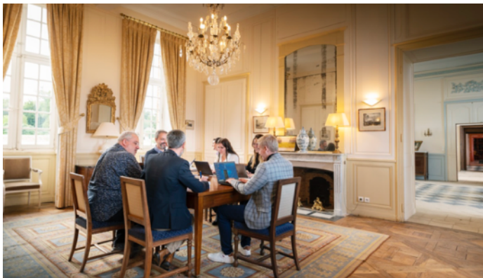
Le Salon Blanc