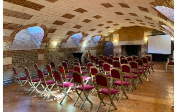
La salle voûtée

En rez-de-jardin, un superbe ensemble de salles voûtées (150m 2 ) permet d'accueillir des déjeuners ou dîners en petit comité, jusqu'à 75 personnes. Il peut également être aménagé pour une conférence jusqu'à 80 personnes.