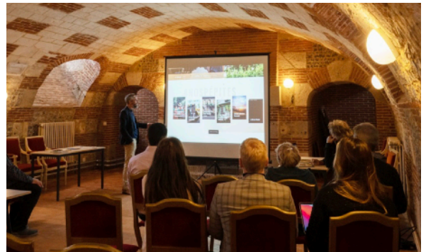
La salle voûtée