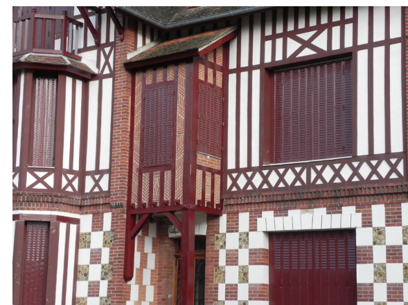
Normandie Sud tourisme