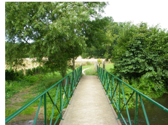
Normandie Sud tourisme