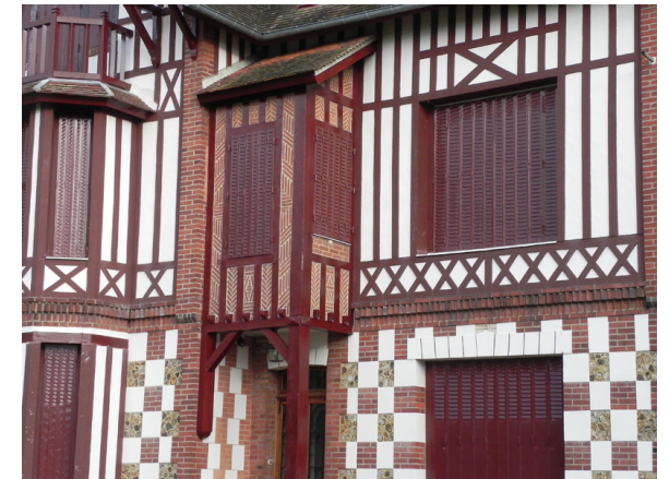
Normandie Sud tourisme