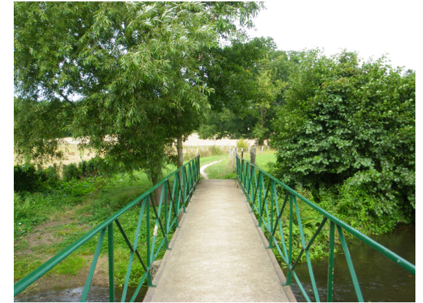
Normandie Sud tourisme

Bourth a depuis très longtemps eu une tradition industrielle, comme en témoignent la grosse forge de Bourth et le haut fourneau. Cette forge fut installée vers 1640 par la famille Leveueur de Tillières au bord de l'Iton pour utiliser sa force motrice hydraulique.