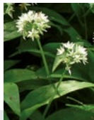
Ail des ours