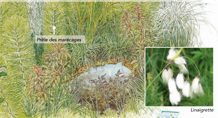
Prêle des marécages

Avant de retrouver le chemin, en haut de la pente, la petite source, bien que parfois tarie, est facilement repérable grâce à la présence de plantes des milieux humides ; la grande Prêle des marécages et la rare Linaigrette à feuilles larges aux inflorescences soyeuses.