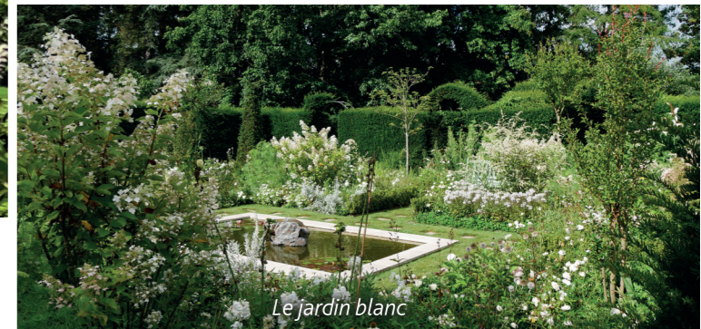
Le jardin blanc