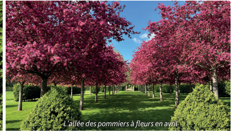
L'allée des pommiers à fleurs en avril

Self-guided tour with a complimentary detailed map for your visit. Free activity booklet for children. Groups can book a guided tour (from 15 people).