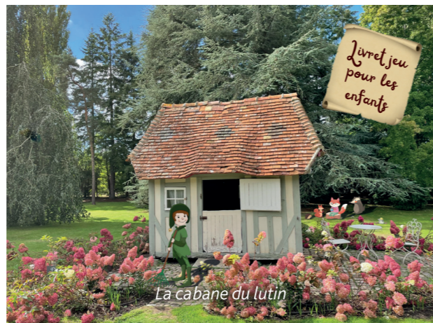
La cabane du lutin