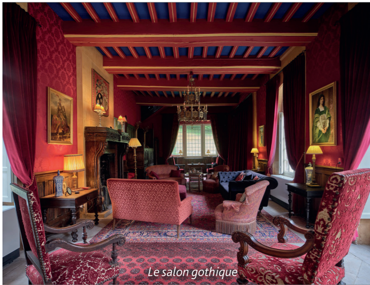
Le salon gothique