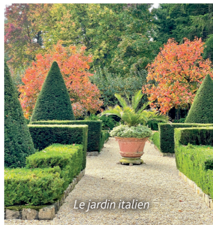
Le jardin italien