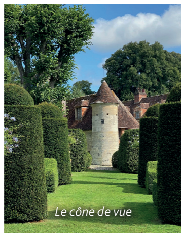
Le cône de vue