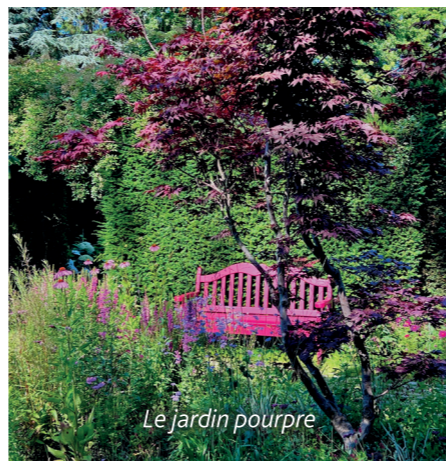
Le jardin pourpre