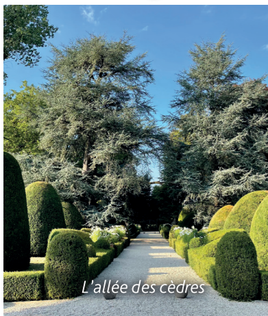
L'allée des cèdres