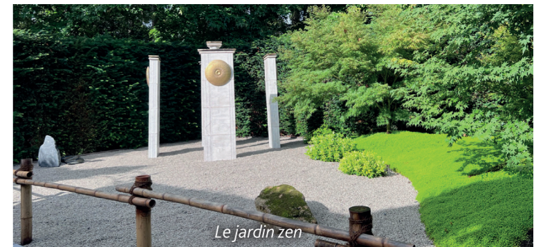
Le jardin zen