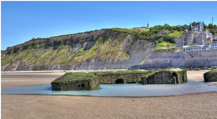
Le port artificiel de Arromanches-Les-Bains