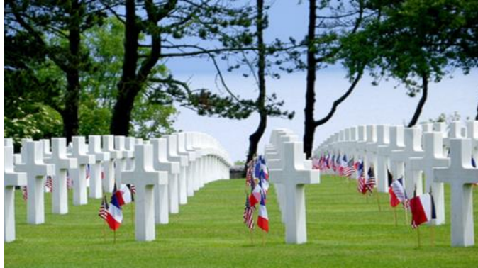
Le Cimetière américain de Saint Laurent sur mer