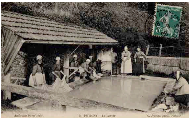
Ambroise Dureau, édité. 5. POTIGNY - Le Lavoir. G. Jeanne, photo, Falaise.