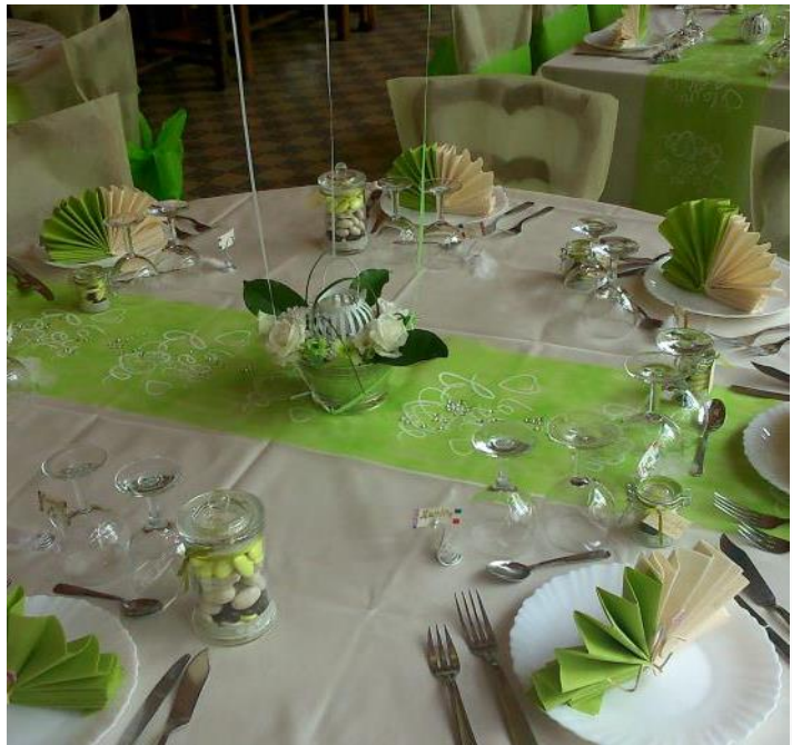
Une mise en place selon vos envies