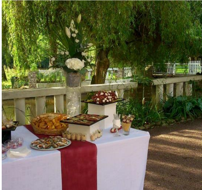
Terrasse au bord de l'Orne de 400m 2