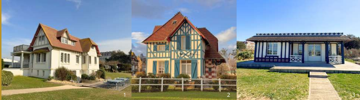
1 : Villa Namouna 2 : Villa Mirabeau 3 : Chalet de la plage