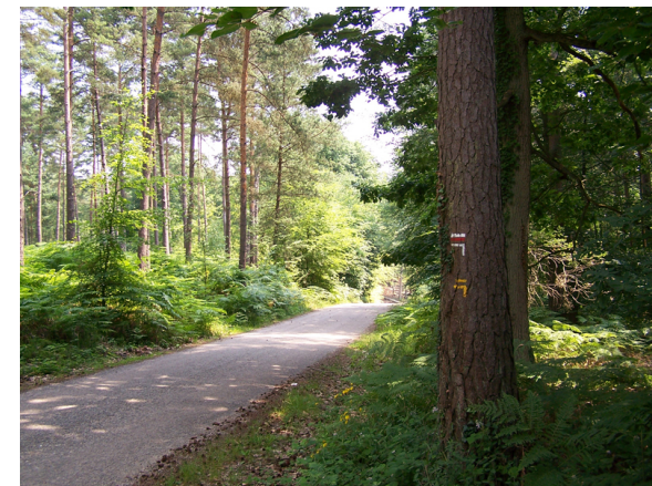
Office de tourisme Seine Eure