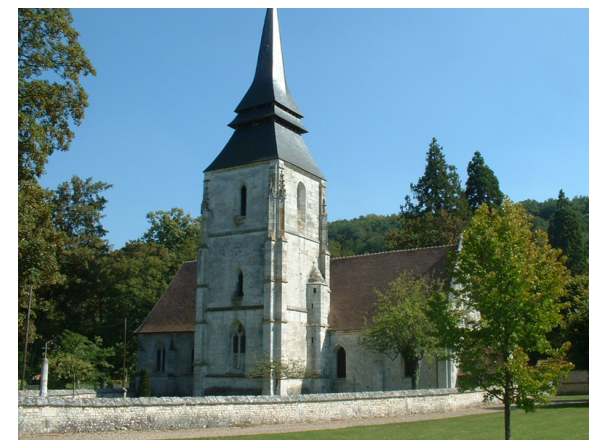
Office de tourisme Seine Eure