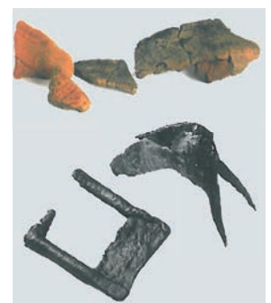
Le matériel gaulois retrouvé sur le site lors de fouilles réalisées en 1986 (Peuchet) - tessons de céramique, pelle ferrée, croc, faux, hache - a permis de dater les remparts vitrifiés, à la fin de l'âge du Fer, juste avant la Conquête romaine.

En effet, ont été découverts sur l'ensemble du site, en plus des remparts : des objets datant du Néolithique (3 500 ans avant J.-C.), du matériel gaulois, des éléments gallo-romains du II e siècle après J.-C., les vestiges d'une forteresse médiévale érigée par Robert de Bellême (Château Gonthier - XII e siècle) ainsi que les ruines d'un château bâti à la fin du XVI e siècle, entre les remparts 2 et 3. Ce dernier fut détruit accidentellement un siècle plus tard, seule la trace d'un colombier est encore visible à ce jour.