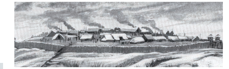
Représentation d'un oppidum, servant à la fois de défense et de refuge pour les gaulois.

A l'instar du site de Bierre (situé à Merri dans l'Orne), il s'agit d'un camp fortifié de hauteur (ou oppidum), de la grande famille des éperons barrés.