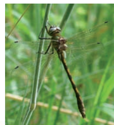
Cordulie à corps fin.