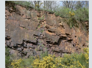
Vue de l'ancienne carrière à cornéennes de La Courbe.

Les cornéennes sont d'anciens schistes et grès du Briovérien (- 560 millions d'années), durcis sous l'effet de la chaleur et de la pression liées à la remontée d'une poche de magma granitique durant la formation des montagnes cadomiennes (- 550 à 540 Ma). Très résistantes, ces roches sont utilisées de longue date pour la construction de remparts... et d'habitations. Celles du bourg de La Courbe en sont un bon exemple.