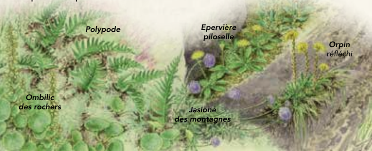
Jasione des montagnes