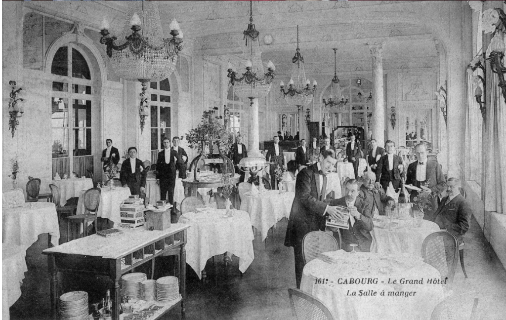
Le restaurant Le Balbec, de nos jours et en 1907