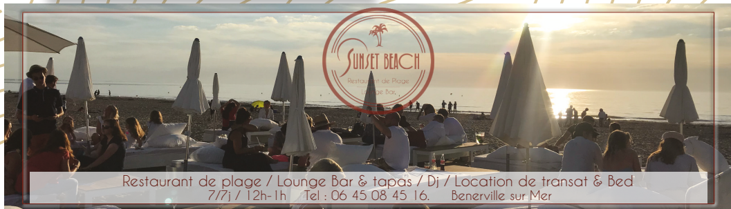
Restaurant de plage / Lounge Bar & tapas / Dj / Location de transat & Bed 7/7j / 12h-1h / Tel : 06 45 08 45 16. Benerville sur Mer