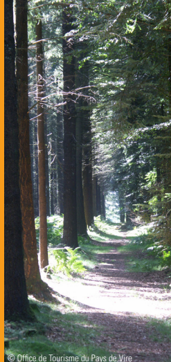
© Office de Tourisme du Pays de Vire