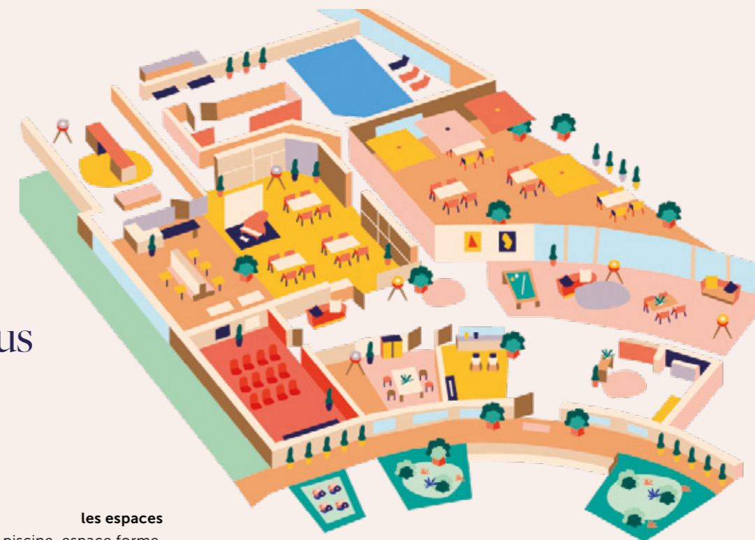
les espaces cinéma, piscine, espace forme, atelier artistique, restaurant, salon.